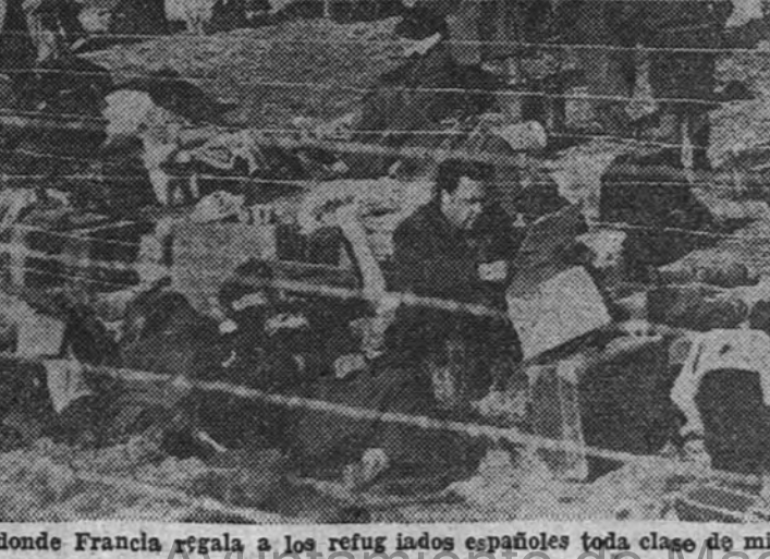
El campo de Argelés, donde Francia regaló a los refugiados españoles toda clase de miserias y mortificaciones

Sabemos que en esta vida austera de Campamento, mitad de soldado y mitad de monje, con esos directores espirituales con sus sotanas raídas de patear con vosotros por los caminos, está la seguridad plena de que la antorcha llegará más viva. Esta es la afirmación más real de España.