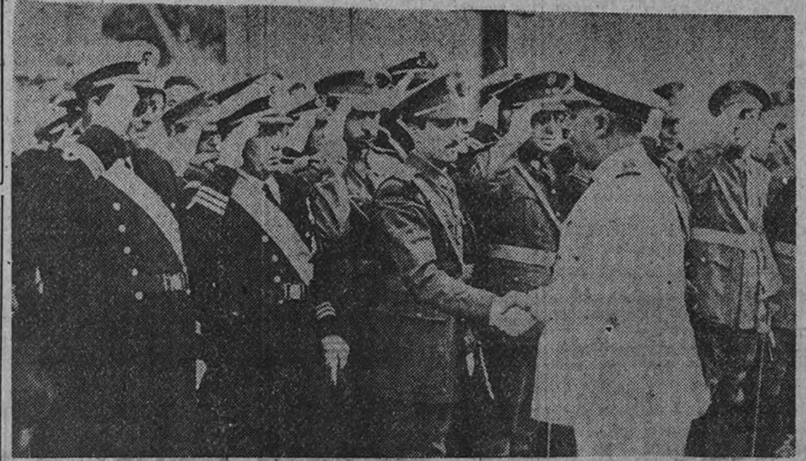
Su Excelencia el Jefe del Estado saluda a los jefes y oficiales de la guarnición que acudieron a recibirle a su llegada a la ciudad. (Foto Cifra).

Los marinos argentinos rindieron ayer homenaje en San Sebastián a los caídos del Baleares