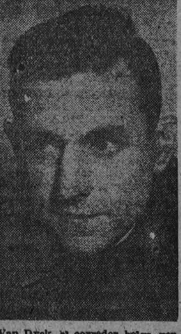
Van Dyck, el corredor belga vencedor de la Vuelta a España, que en la etapa Logroño-Pamplona del Gran Premio "Marca" triunfó al sprint.

PAMPLONA 9. (De nuestro especial, Guzmán Ramos).—La segunda etapa del Gran Premio "Marca", corrida esta tarde por 10 kilómetros de Logroño a Pamplona, más 45 kilómetros de Pamplona a la capital navarra, en un total de 55 kilómetros, ha servido para revalidar el éxito logrado por el corredor belga Van Dyck en la gran prueba de su jornada. Para no andarnos con rodeos, diremos que la carrera se desarrolló a una marcha tan rápida que, francamente, no recordamos nada semejante en estos últimos tiempos. Un detalle bastante curioso es el de que, para la confirmación de la victoria, Van Dyck, que llevaba una ventaja de 35,460; hoy, la media fue de 36,700. Lo que basta para que todos se den cuenta de la gran idea de que en el Gran Premio "Marca" se corre, en condiciones de ninguna manera, y todos han venido a dar gloria a la ciudad.