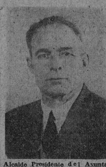
Alcalde Presidente del Ayuntamiento de San Lorenzo del Escorial

pre para el aficionado... y para el que no lo es. Concursos de diversa índole, actos religiosos y cívicos, etc., completan los festejos de la "capital de la sierra", que estos días a sus numerosos atractivos uno los que se derivan de la celebración de su santo Patrón.