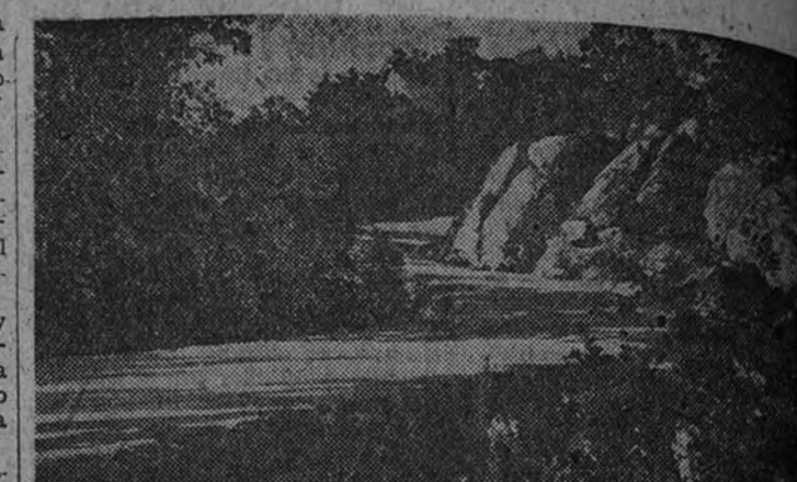
Camino de la Silla de Felipe II

Por ejemplo, en el Gremio de la Construcción hay 900 obreros sindicados. La cantidad en salarios que se invierte es de 6.335.000 pesetas, y su movimiento de tipo social es interesantísimo, por tratarse de un gremio en período de rápido crecimiento.