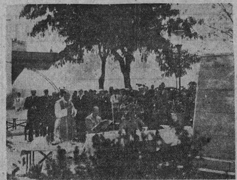
Momento de la celebración de la santa misa en sufragio de los caídos en aquella fecha memorable en el Depósito Central de la Remonta, a la que asistieron numerosas autoridades y deudos de aquellos

En el Depósito Central de la Remonta se celebró una misa en sufragio de los héroes caídos