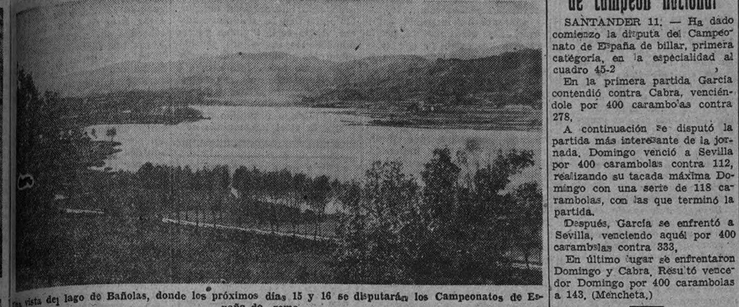
Una vista del lago de Bañolas, donde los próximos días 15 y 16 se disputarán los Campeonatos de España de remo

Comprenden los de canoes, yolas, "skiff" y "outriggers" a cuatro y ocho