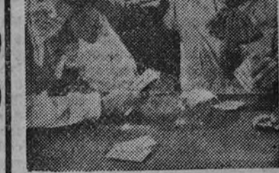
La película mejicana que más éxito alcanzó en América es "Ay Jalisco, no te rajes!", que presentada por Procinas se estrenará el lunes próximo en el cine Imperial como inauguración de su temporada oficial. He aquí a su protagonista, el cantante Jorge Negrete, en una sugestiva escena con el divertidísimo Chaplín.

ES POSIBLE QUE EL PORTUGUES FELICIANO FIRME POR EL CELTA