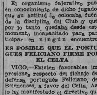
El organismo federativo puso en conocimiento de dicho jugador que su actitud le colocaba fuera de la disciplina del Club y que, por lo tanto, quedaba desde ese momento, incapacitado para participar en ningún encuentro.

armario y avión. — Carteras documentos. — SAGASTA, 4