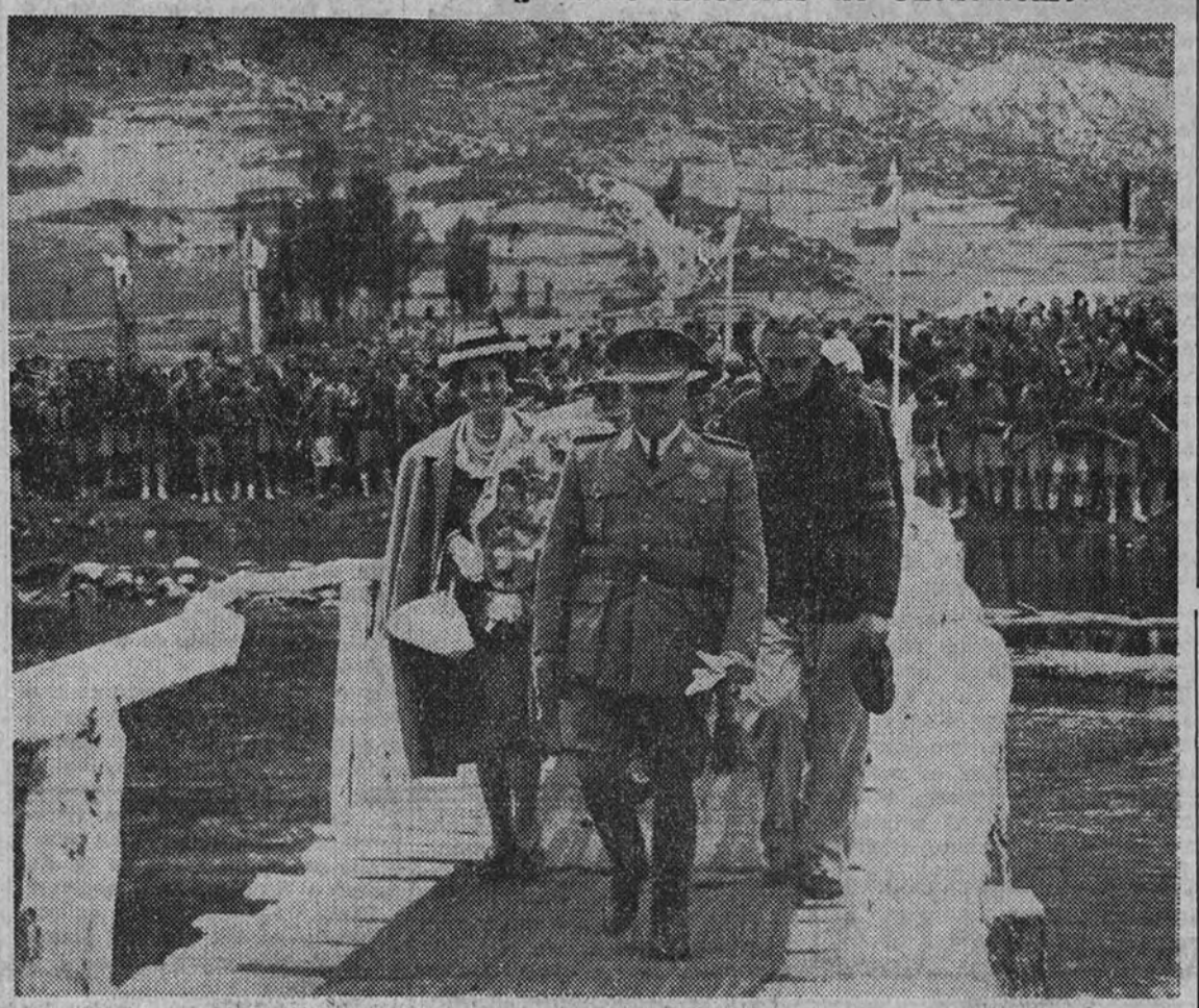
Su Excelencia el Jefe del Estado, acompañado de su esposa y del Delegado Nacional del Frente de Juventudes, en su visita al Campamento Nacional el 8 de Julio, instalado en Riaño

El paso de Franco por Pontevedra y otras localidades fué acogido por los vecindarios con grandes muestras de entusiasmo