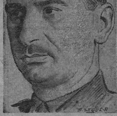
cedido a contestar nuestras preguntas. Ante el micrófono, pues, se encuentra el excentrismo señor don José Luis de Arrese, a quien preguntamos: