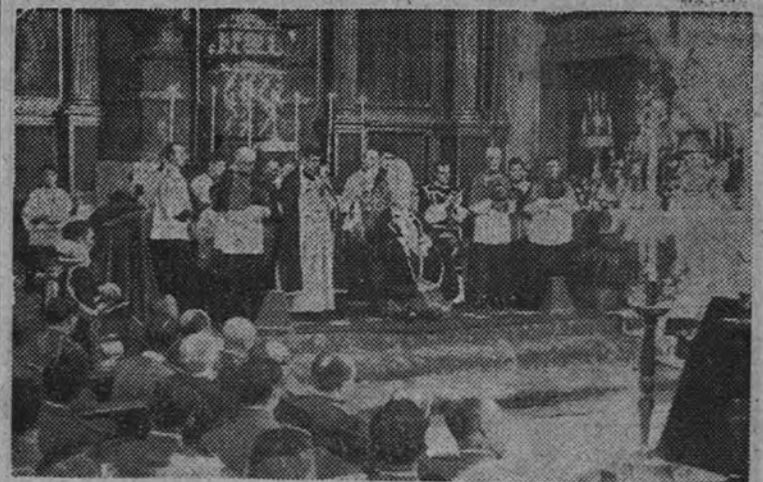
El patriarca de las Indias duraó los solemnes funerales

Asistieron el obispo de Madrid-Alcalá y las autoridades provinciales