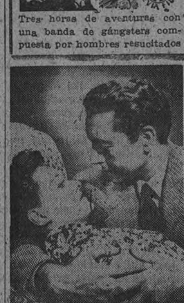
Palacio de la Música y Warner Bros ofrecerán al público, desde el próximo lunes, el extraordinario film "La extraña pasajera", con la admirable interpretación de Bette Davis y Paul Henreid