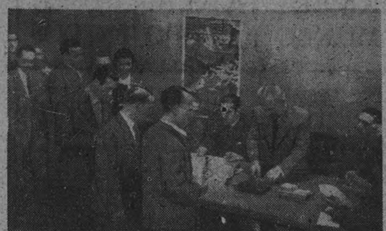
Un momento de la votación en nuestros talleres, durante el acto celebrado ayer tarde en los mismos, para elegir Enlaces Jurados.