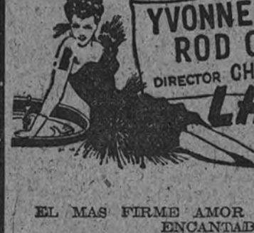
Yvonne de Carlo y Rod Cameron en una de las escenas de "La dama de la frontera", dirigida por Charles Lamont

Un éxito inigualado, sin comparación posible!