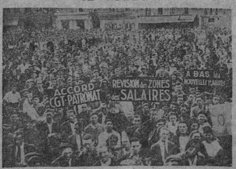
Una manifestación en la ciudad de Limoges, en la que las organizaciones izquierdistas exhiben pancartas con sus peticiones.