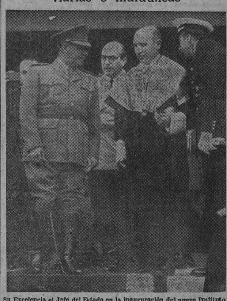
Su Excelencia el Jefe del Estado en la inauguración del nuevo Instituto de Segunda Enseñanza de La Coruña.

Los señores Fernández Ladreda y Suanzes inspeccionan obras ferroviarias e hidráulicas