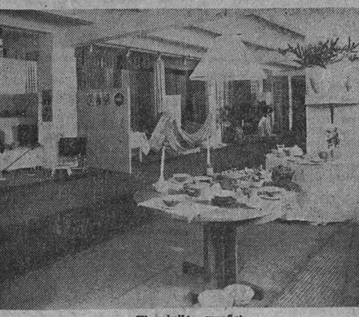
El pabellón español

UTRECHT, septiembre de 1947. Todo español que sale por el mundo en nuestros días abraza cierta preocupación sobre la forma en que su presencia será acogida más allá de las fronteras de la Patria. La propaganda de nuestros enemigos, y la confusión mental que una Prensa más o menos directamente a su servicio ha creado en las mentes sencillas dan lugar a que el hombre de la calle, en muchos lugares, piense que un español de 1947 que viene de España es natural de un pueblo beligerante y huracán dispuesto a poner por sí solo en peligro nada menos que toda posibilidad de entendimiento y de concordia universal. Estos días hemos atravesado una experiencia interesante sobre esta tierra llana, ordenada, limpia y marinera de Holanda: la Feria Real de Utrech, que abre sus puertas dos veces al año, en primavera y en otoño, ha albergado por primera vez en cincuenta años una nutrida representación del comercio español. No han estado so-