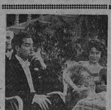
En el Rex continúa el éxito en segunda semana de la producción Suevia Films - Cesáreo González "El emigrado"