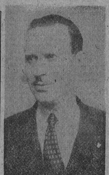
El presidente de la Federación Española, don Juan Ruiz Flores, al que corresponde gran parte del éxito del Campeonato mundial de billar de Zaragoza

El éxito alcanzado por el Campeonato del mundo de billar al cuadro 45-2, que el domingo fue regularidad, que a buen promedio organizó la Peña Motorista Galapagar el pasado junio, hasta la fecha, no nos ha sido doblemente temporal ninguna otra prueba de mototécnica; pero, continuando con la trayectoria de esta competición, nos ofrece para el próximo domingo, día 5, una de las pruebas más interesantes y difíciles de cuantas se pueden organizar en el deporte motorista. Esta carrera, que hacia muchísimos años que no se organizaba, ha sido clásica en la historia del mototismo madrileño y español, y ha sido banco de pruebas de máquinas y pilotos. El récord absoluto de la prueba está establecido a más de noventa kilómetros por hora, y según los más optimistas, este será batido fácilmente, si los elementos no se oponen a ello, por las máquinas de hoy en día. Esto por sí solo habla con más elocuencia de la importancia de la prueba proyectada. Otro atractivo más de esta carrera es que en ella podrán tomar parte automovilistas, aumentando más, el cable, con la presencia de éstos la espectacularidad y belleza de la carrera.