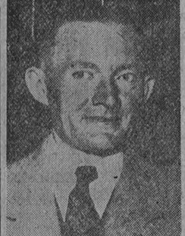
Van de Pol, actual campeón mundial de billar al cuadro 45-2

Van de Pol, el campeón del mundo de billar, el jugador "americano" como lo han calificado los técnicos de esta popular modalidad deportiva, ha pasado una semana en Madrid, sus días de estancia en la capital de España han sido poderosos, hasta el punto que ha renunciado a las partidas de exhibición en honor de la ciudad de Zaragoza, donde ha pasado unas horas antes de partir para su país, a rivalizar con el campeón del mundo.