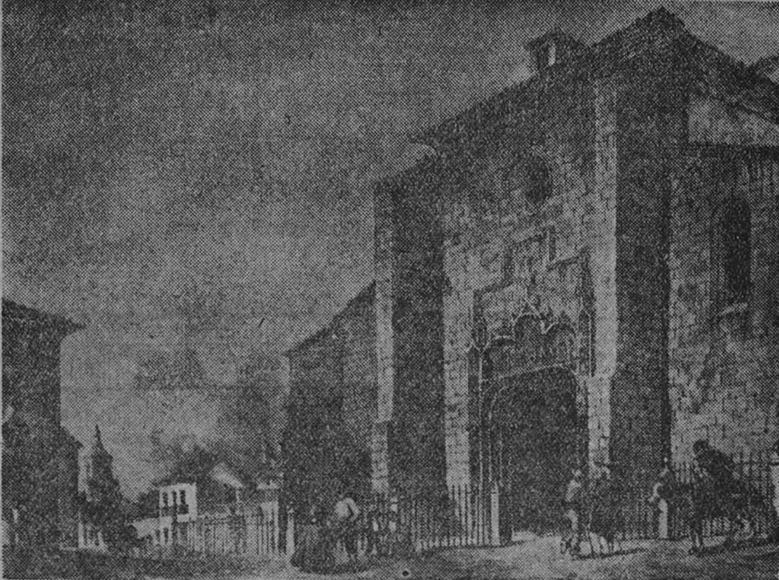
Colegiata de Santa María en Alcalá de Henares, según un grabado de la época, tal y como estaba cuando en una de sus capillas, en la d el Oidor, fué bautizado Cervantes

La capilla de San Ildefonso, en la Universidad complutense, fué fundada por Cisneros para que reposaran en ella sus restos