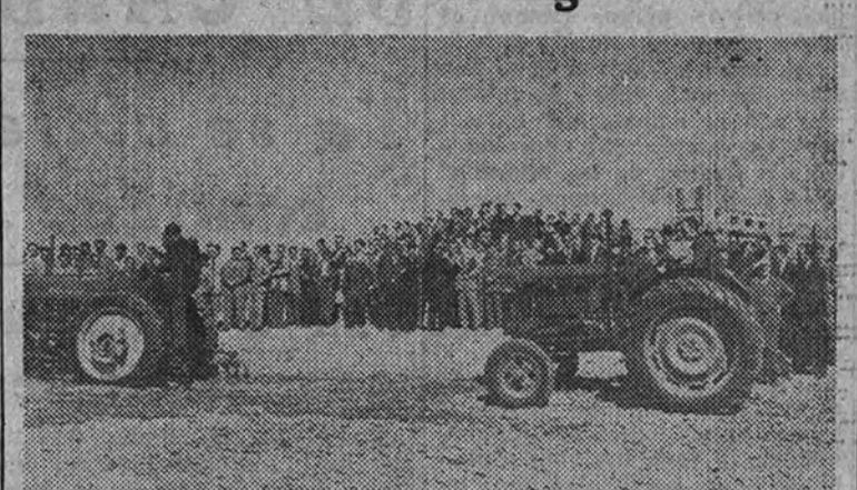
En los campos de la Escuela Especial de Ingenieros Agrónomos de la Moncloa fué clausurado ayer mañana el curso práctico de tractoristas. Los cursillistas, obreros agrícolas de diversas provincias, realizaron demostraciones de la pericia adquirida en estos cursillos

Sobre este particular merece destacarse que las acciones de la Chade correspondientes a españoles han estado ya depositadas en los años 1938 a 1943, sin que mereciera dicho depósito protesta o disconformidad, sino que, por el contrario, en alguna Junta general de accionistas se distinguió al representante del Instituto Español de Moneda Extranjera, al designarse como escrutador. Por otra parte, el hecho del depósito no impidió entonces, ni impide ahora, a los propietarios de las acciones el ejercicio de todos sus derechos, entre ellos el de asistencia a las Juntas generales, y buena prueba es que en los años antes citados acudieron a ellas los accionistas que así lo desearon. El Instituto de Moneda, pues, en este caso, actúa exactamente igual que una entidad bancaria, cualquiera encargada de la custodia de unos títulos.