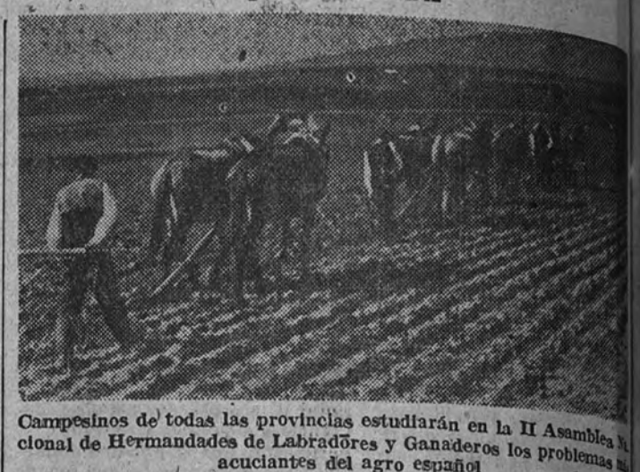
Campesinos de todas las provincias estudiarán en la II Asamblea Nacional de Hermandades de Labradores y Ganaderos los problemas más acuciantes del agro español

Confió en que esta manifestación de los campesinos españoles una vez más el arraigo de la Organización Sindical, y su unidad de cauce lógico y natural para elevar las iniciativas del pueblo hacia el Estado.