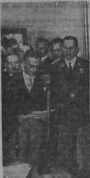
El ministro de Instrucción Pública de la Argentina leyendo su discurso en la inauguración de la Exposición de Arte Español Contemporáneo

—La sala de escultura es magnífica. Allí sostienen bien nuestro pabellón, entre otros prestigiosos nombres, los de Clará, Casanova, Aduraz, Pérez Comendador, Ferrant, Laviada y Planes, que han