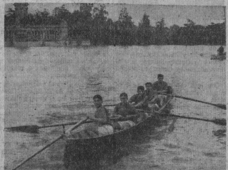
La tripulación de Laredo, vencedora en el Campeonato de España de bateles, celebrado en el Retiro

EN LA PRUEBA DE CONSOLACION VENCIO AVILES