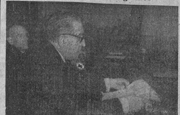
El doctor Maraño desarrollando su conferencia acerca de la "Muerte de Garcilaso", durante el acto celebrado ayer por la Asociación de Escritores Médicos.

El profesor Mc. Guire pronunció su conferencia sobre "Política demográfica"