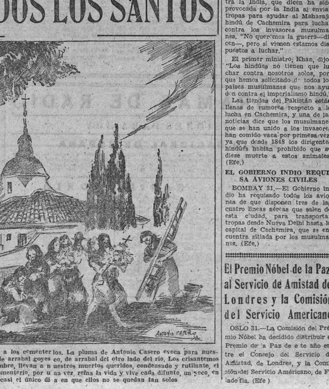
Se realiza la tradicional visita a los cementerios. La pluma de Antonio Casero evoca para nuestros lectores una escena madrileña de arrabal gótico, de arrabal del otro lado del río. Los orientados frescos, en el día primero de noviembre, llevan a nuestros muertos queridos, condensado y rutilante el recuerdo de muchos días, y en el cementerio, por una vez, reina la vida y vive cada difunto, un poco, en el alma de todos; es casi el único día en que ellos no se quedan tan solos