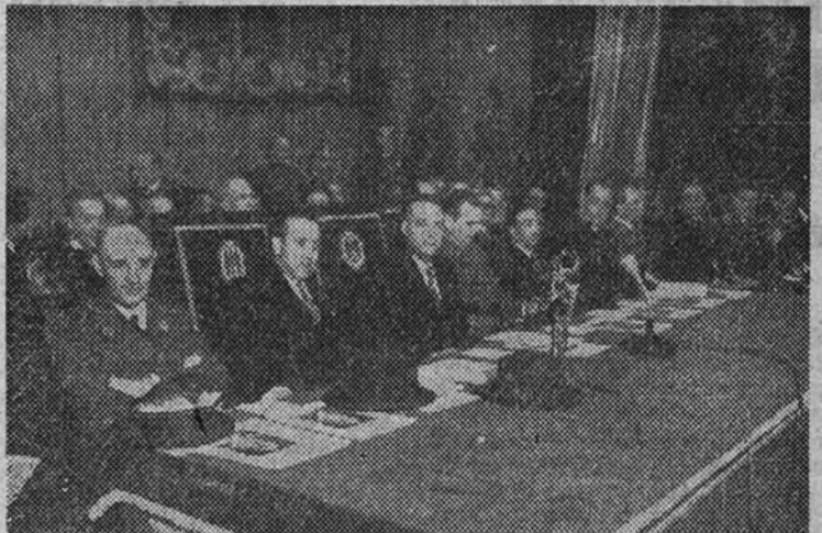
El Ministro de la Gobernación con las demás personalidades que presidieron la sesión inaugural del IV Congreso Nacional de la Sanidad Municipal, celebrada ayer en el cine Capitol.

A la altura, para nosotros inconcebible, de más de cuatro kilómetros sobre el nivel del Pacífico se ha producido este movimiento sísmico en los Andes peruanos. Aseguran los buenos geógrafos que no son tan inquietas como las ecuatorianas las tierras del Perú; pero lo cierto es que varios pueblos afectados lamentan ahora la alteración de la tranquilidad que venían disfrutando. El Cerro de Pasco, ya conocido por su riqueza minera de cobre, de plata y de oro, y sus 200.000 toneladas anuales de hulla; La Merced, San Ramón, Acobamba, Tarma, Huancayo, Isechaca y Huando han sido alcanzados, en mayor o menor intensidad, por la onda sísmica, que, según las noticias recibidas, afecta aproximadamente al círculo señalado en el gráfico.