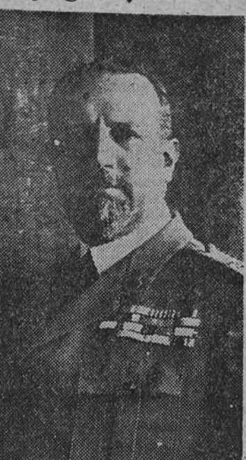
Volpi de Misurata

ROMA.—A los setenta años ha fallecido en un hospital de esta ciudad el conde Volpi, que fué ministro de Hacienda con Mussolini. A la caída del fascismo huyó a Suiza, siendo juzgado y absuelto a su regreso a Italia.