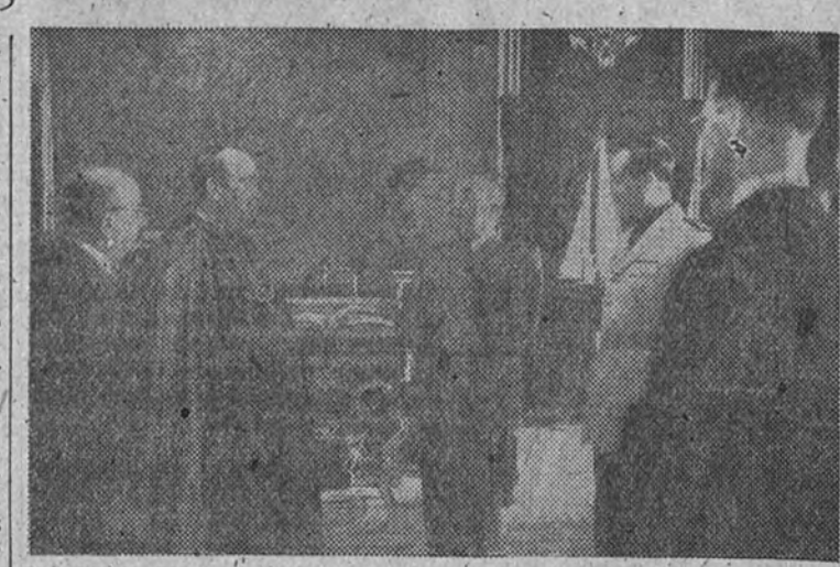
Su Excelencia el Jefe del Estado recibe en el Palacio de El Pardo a la Comisión de Alaya que le hizo entrega de la segunda Medalla «Francisco de Vitoria»