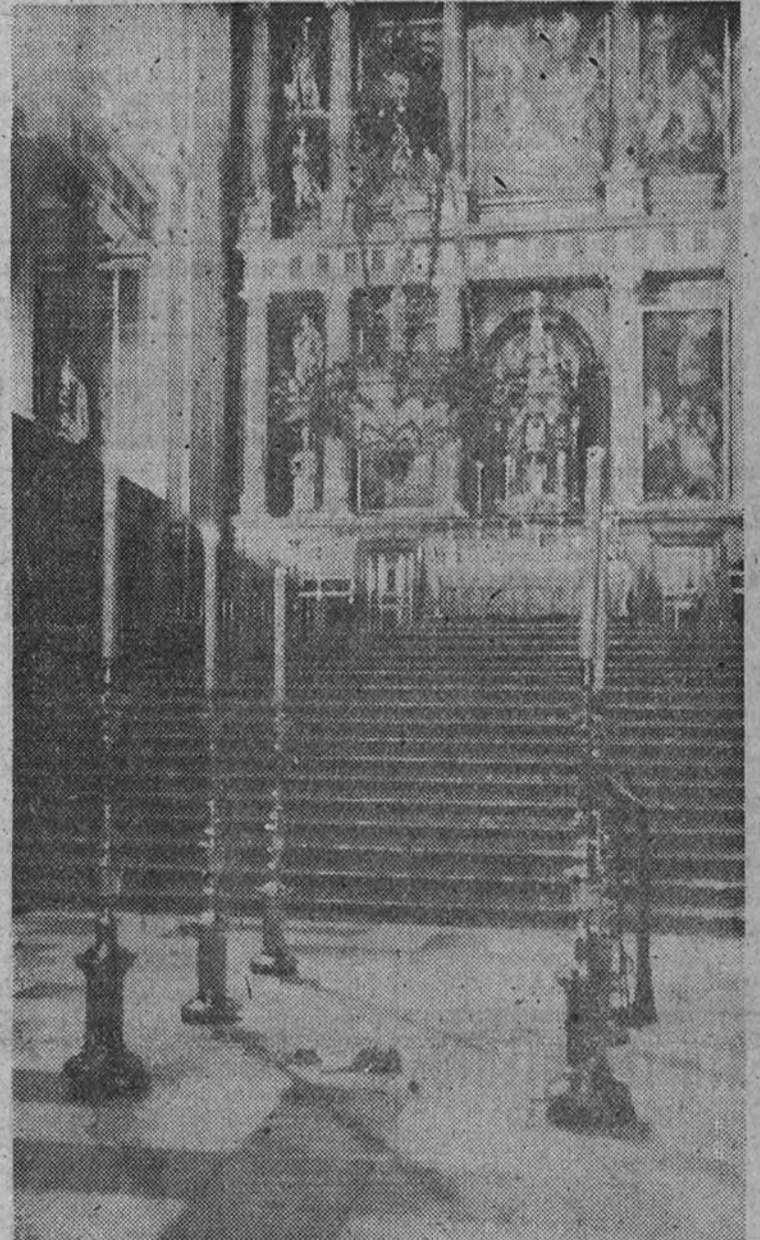
Sobre la tumba de José Antonio las cinco rosas simbólicas