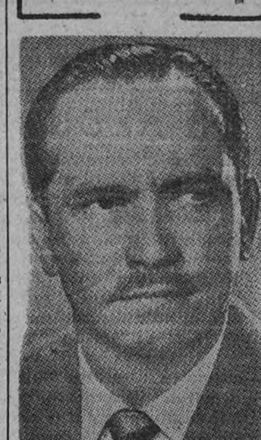
Fredric March, protagonista de la gran película triunfante en todo el mundo, "Los mejores años de nuestra vida", próximo acontecimiento cinematográfico presentado por Filmófono, S. A.