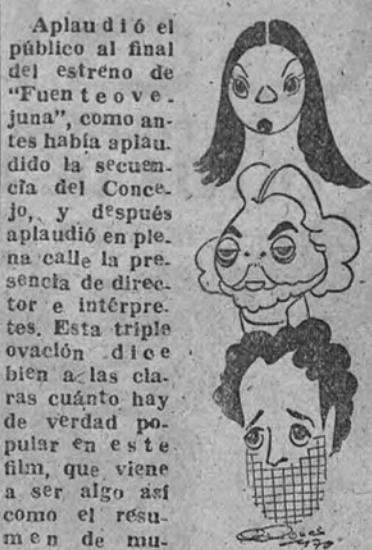
Amparito Rivelles, Manuel Luna y Fernando Rey

Applaudió el público al final del estreno de "Fuenteovejuna", como antes había aplaudido la secuencia del Concejo, y después aplaudió en plena calle la presencia de director e intérpretes. Esta triple ovación dice bien a las claras cuánto hay de verdad popular en este film, que viene a ser algo así como el resumen de muchas experiencias cinematográficas en el campo de las relaciones entre el público y nuestra producción.