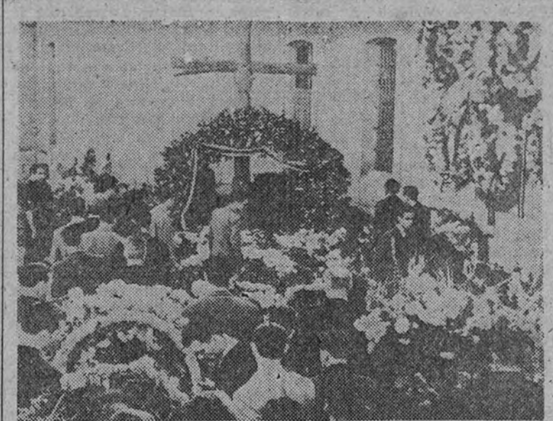
El lugar donde cayó asesinado el Jefe Nacional de la Falange, en la prisión de Alicante, cubierto de flores ofrecidas por las distintas representaciones que acudieron a los actos conmemorativos allí celebrados