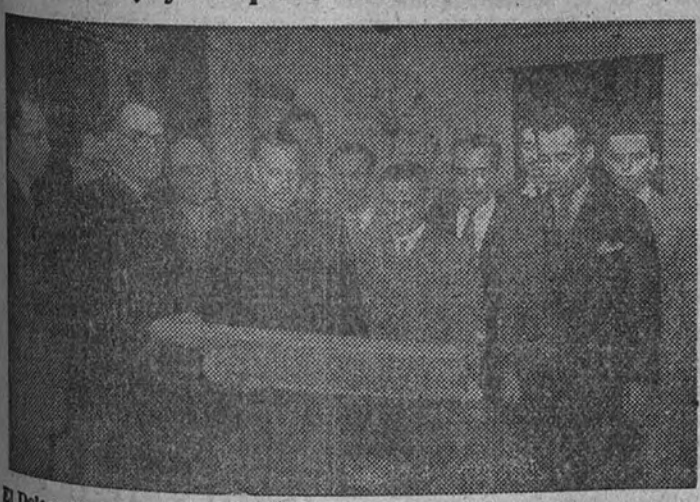
El Delegado Nacional de Sindicatos recibiendo el pergamino que ayer le entregó la Comisión de obreros de Cádiz

Asistieron al acto el Gobernador de Cádiz y jerarquías sindicales