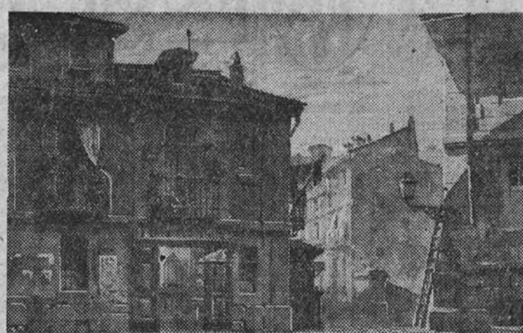
Boceto de decorado para el cuadro segundo de «La Revoltosa», realizado por Amalio Fernández en 1897

Mari Pepa y Felipe entrecruzan quejas y amorosos transportes: «¿Por qué de mis ojos los tuyos retiras, por qué? ¿Por qué me desprecias, por qué no me miras, por qué?». Pronto ella, entregada toda en la frase, confiesa, entre suspiros: «¡Ay, Felipe de mi vida!» El canta, piropea, se vuelve de lleno con admiración y júbilo: «La de los claveles dobles la del manito de rosa... eres tú, porque te quiero...». Esta noche, en el teatro Calderón, la compañía que mayor constancia y entusiasmo acredita en el servicio de nuestro género lírico, interpretará «La Revoltosa». Al aplaudirla, galana y florida, con siempre renovados aliciosos, tan «graciosa» como cuando va la luz, guardaremos, si, un recuerdo emocionado y devoto a la memoria de sus autores; también quedará lugar al deseo y la esperanza de que los músicos y libretistas contemporáneos se impongan—ante el ejemplo incomparable del pasado—el deber de trabajar con afanes de superación y acierto. Eso, de una parte. De otra, elevaremos una íntima y ferviente súplica a quienes, con su ayuda, pueden hacer factible el desarrollo normal de la vida lírica, hoy en grave peligro de consunción, ante las casi insalvables dificultades existentes. Un género que cuenta con frutos tan admirables como «La Revoltosa» no puede desaparecer. La frase, con verdad, ya, por el uso, en tópico.