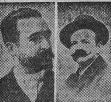
Carlos Fernández Shaw y Ruperto Chapí

pasó a ser angustioso S. O. S. que lanzamos convencidos de que, atendiendo, se realizaría una obra de auténtico interés nacional. ¿Qué día más indicado que éste, en que se conmemora una efeméride gloriosa?