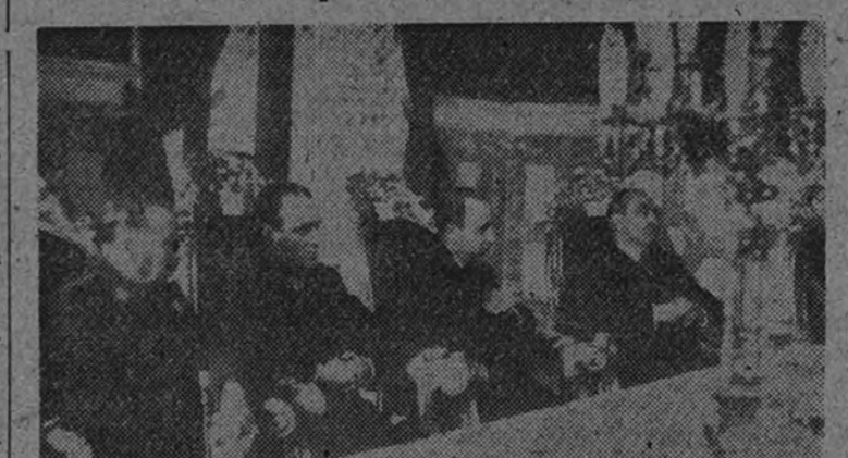
El Subsecretario de Educación Popular y las otras personalidades que presidieron la apertura de la Asamblea Nacional de Asociaciones de Prensa, celebrada en Sevilla.

Asistieron al solemne acto el Subsecretario de Educación Popular y el director de Prensa