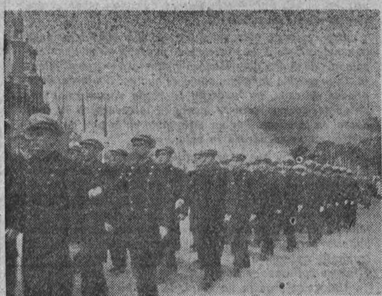
Los alumnos de la Escuela de Aviación Militar argentina desfilan marcialmente ante el monumento a Colón, entre constantes ovaciones y aplausos del público.

precididos de las tropas del Aire españolas, desfilaron ante las autoridades y el monumento, marchando poco después a ocupar los autocares que les habían de conducir a los respectivos hoteles en los que se alojaron. El público, al descubrir su paso, les tributó por las calles de Madrid grandes aplausos y vivas a la Argentina y a Perón.