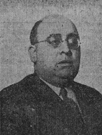
José María de Cossío, Académico de la Española. Esta noticia de que tiene largo y expreso antecedente: la vida de este escritor ha sido orientada en una preocupación constante por la alta crítica literaria y por la historia de nuestras costumbres más arraigadas. Nuestro ilustre colaborador penetra en la asamblea de los vigilantes del idioma por derechos mantenidos con gran tesón y prosapia.

González Anaya es el novelista popular por excelencia. Su comienzo literario, con un libro de poemas prologado por Manuel Reina, está en esta época tan interesante de comienzos del modernismo. Desde 1903, en que publica su primera novela, “Rebelión”, se ha dedicado a la literatura narrativa, en la que ha obtenido numerosos éxitos. Es, ante todo, el novelista de Andalucía, exaltador de valores de tipismo. Así, en “Los naranjos de la Mezquita”. Otras novelas suyas, también muy leídas y gustadas, son: “Nido de cigüeñas”, de ella dice “Andrenio” eclogas, tanto del estilo como de los personajes. “La oración de la tarde”, conjunto de viñetas grandiosas, sencillas, líricas e interesantes, con una leveza satírica que pareciera ya en las primeras obras del autor. González Anaya representa la literatura regional en una modalidad que no ha sido continuada. Ha gozado de éxitos rotundos, y muchos de sus libros son leídos con interés y agrado. Ahora la distinción que tan justamente le otorga la Real Academia Española es el justo premio a una vida entregada con decidida vocación y jugoso fruto a las letras y a una región española.