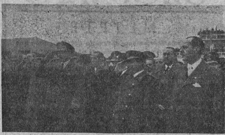
El Ministro del Aire, con las autoridades españolas y argentinas, escuchó los himnos de ambos países en el aeropuerto de Barajas.

PARIS 4. —Los obreros ferroviarios en huelga ocuparon la estación de Lyon, impidiendo la salida del expreso París-Ginebra.