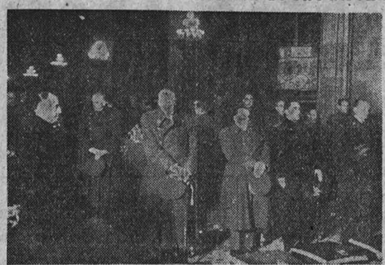
Los Ministros del Ejército, Marina y Obras Públicas, presidiendo la fiesta religiosa celebrada por los artilleros en honor de Santa Bárbara.

El Caudillo, que estaba acompa- ñado del jefe de su Casa Militar,