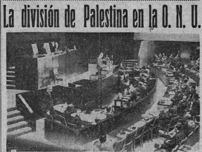
Sir Alexander Cadogan, jefe de la Delegación británica en la Asamblea General de las Naciones Unidas, en el momento de dar lectura a un discurso dirigido a los representantes de los Estados belgas antes de proceder a la votación sobre la cuestión de Palestina que dio como resultado la división de este país en dos Estados.

En vista de total desacuerdo en cuestión, se decidió por iniciativa del secretario de Estado norteamericano pasar al siguiente punto del temario de la Conferencia, y se levantó seguidamente la sesión.