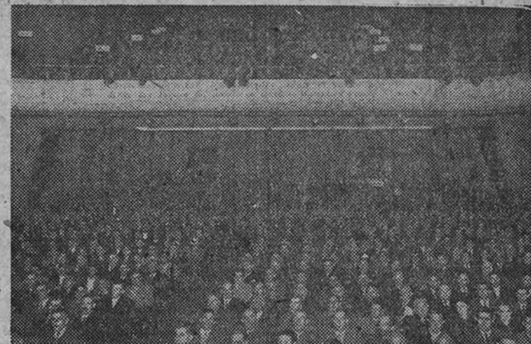
Aspecto del teatro Madrid en la apertura de la II Asamblea Nacional de Labradores y Ganaderos, integrada por más de 3.000 representantes.

Los alienta para un robustecimiento de la Organización campesina y destaca la creación de