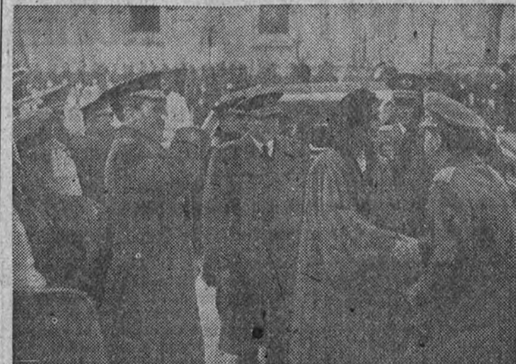
La excelentísima señora doña Carmen Polo de Franco al llegar a la capilla de Nuestra Señora de Loreto.

Asistieron también los Ministros del Aire, Marina y Gobernación