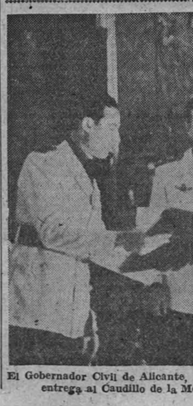
El Gobernador Civil de Alicante, con la Comisión de Orihuela, hace entrega al Caudillo de la Medalla de Oro de dicha ciudad

AUDIENCIAS MILITAR Y CIVIL Su Excelencia el Jefe del Estado (Continúa en cuarta pág.)