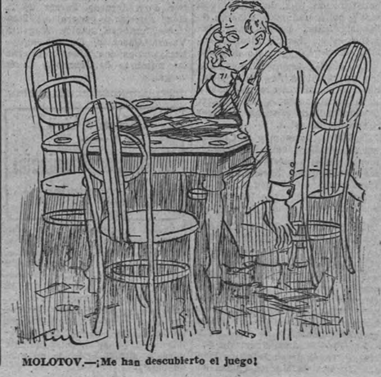
MOLOTOV.—Me has descubierto el juego!

Se le permitirá participar en la distribución del oro que fué enviado a Alemania