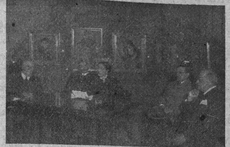
Ayer se inauguró el V Salón de los Once en el Museo de Arte Moderno con una conferencia de Conchita Montes, que fue calurosamente aplaudida por la concurrencia, y que apareció en esta foto durante un momento de su disertación.

Conferencia de la actriz Conchita Montes