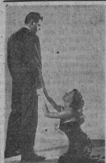
El nuevo galán Glenn Ford y la estrella Rita Hayworth en la superproducción Columbia "Gilda", que se estrenará próximamente en un salón de la Gran Vía

EVITA MUÑOZ ES HOY LA ESTRELLA MAS POPULAR EN HISPANOAMERICA. MANANA LO SERA EN MADRID