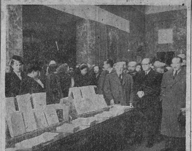
El Ministro de Educación Nacional en el acto inaugural de la Exposición de la Biblioteca Mejicana, que se celebró ayer a mediodía en el Consejo Superior de Investigaciones Científicas.

(Viene de primera página.) cer de España. Esta sirvió siempre y México es un ejemplo magnífico—las causas inmateriales, las causas de Dios. Había luego de la obra que el Estado ha realizado, en distintos órdenes culturales, en favor de los estudios hispanoamericanos. A través de esta biblioteca y de la que un día habrá recíprocamente en México, los dos países irán forzosamente a su rescuerdo. Hizo a continuación una hermosa semblanza de la figura gigantesca de Hernán Cortés y pidió, por último, que la Virgen de Guadalupe inspire a los estudiantes mejicanos para que sea una realidad la comunidad hispanoamericana. Afirmando las raíces espirituales que unen a todos estos pueblos, deben ser defendidos el orgullo histórico, la dignidad presente y la misión futura de estas naciones, tan ligadas a nuestra Patria.