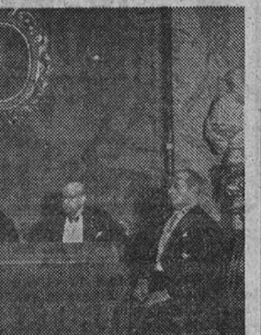
En la Academia de San Fernando se celebró, bajo la presidencia del conde de Romanones, el acto de homenaje a la memoria de Manuel de Falla, interviniendo en él los señores Conrado del Campo y Cubelles, que fueron aplaudidos. Esta foto recoge el centro del estrado durante el acto.