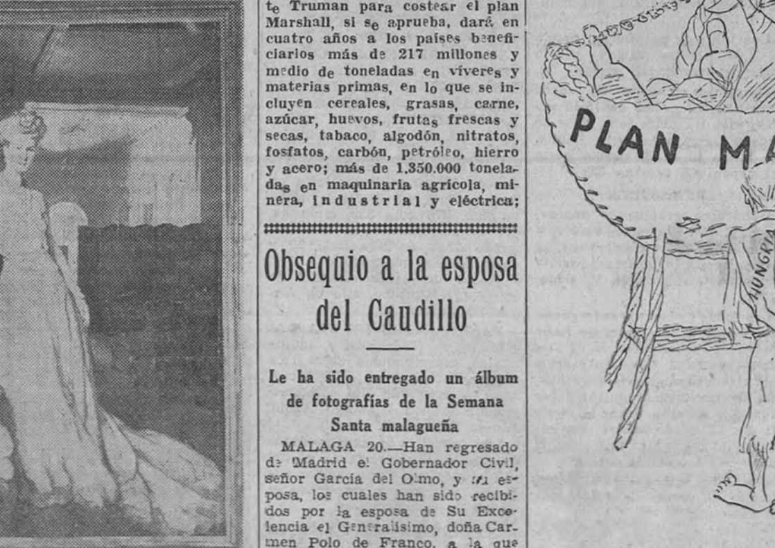
Estos magníficos retratos del Presidente de la República Argentina, general Perón, y de su esposa, doña Eva Duarte, de los que es autor el director del Museo del Prado, Álvarez de Sotomayor, son un ejemplo más de la valía y la calidad de las obras de este eminente pintor, que con motivo de la Exposición de arte español contemporáneo celebrada recientemente en Buenos Aires fué objeto de reiteradas muestras de admiración y merecidos homenajes, de los que nos sentimos orgullosos todos los españoles.