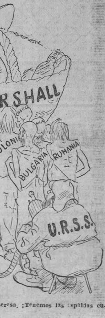
LOS SATELITES.—No nos interesa. Tenemos las espaldas cubiertas!