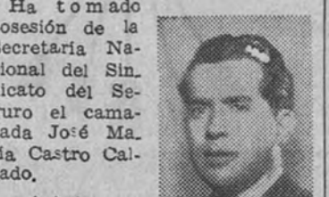
El nuevo Secretario Nacional del Seguro