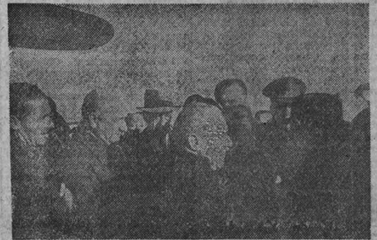
El conde de Guadalhorce es saludado en Barajas por los miembros del Gobierno y altas personalidades que acudieron a recibirlo