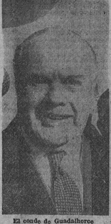
El conde de Guadalhorce

la liquidación con el Estado de estas obras. Estas luchas en nada me han hecho disminuir el cariño especial que aquel país me merece por todos conceptos, y, además, por la conducta que hoy está siguiendo su Presidente de carino y respeto hacia España. Las luchas, por muy duras que sean, (Continúa en cuarta pág.)