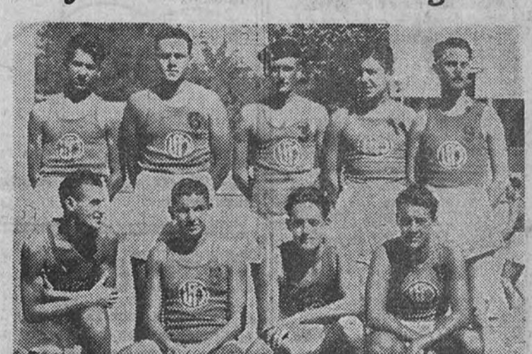
El equipo del Liceo Francés, que el domingo juega con el Canoe el encuentro más interesante de la jornada.

Después de la interrupción sufrida por las vacaciones de Navidad, el domingo se reanuda el Campeonato regional de primera categoría, con una jornada que si no es de las más emocionantes, tampoco deja de tener alicientes. El encuentro más interesante de los cinco que se disputan es el que en la cancha de Barceló jugarán el Canoe y el Liceo Francés.