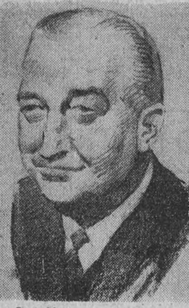
José Álvarez de Sotomayor

Recordar y recordar. Arte. He aquí una cuestión difícil e impertinente. Cuando el recuerdo crece con gracia sencilla en la memoria, no vale. En otro aspecto..., en otro aspecto recordamos el chiste de "La Codorniz". Un matrimonio con guía en mano visita un museo. El marido dice, alarmado, a la mujer: "Toma nota de los cuadros que estamos viendo... ¡no sea que los vayamos a ver dos veces!". Este es el caso. Recordar... bien. Pero recordar tantos paisajes horribles o tantos retratos de "Mi madre", o "Mi mujer en la ventana", o "Manzanitas"... ¿no es un dolor que debemos evitar en este año, en el que tenemos ya una colmada experiencia?