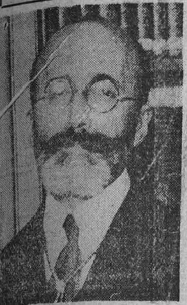
Ramón Menéndez Pidal