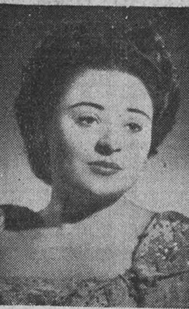
Victoria de los Angeles

En lo fundamental apenas puede intentarse un comentario capaz de reflejar la fisonomía peculiar del año que concluye. Persiste la gran avalanche de conciertos, el incremento de afición, el nivel de general decoro en el aspect interpretativo, se mantiene también el penoso desamparo en que la música vive, si marco a ella concretamente vinculado, sujeta fatalmente a la servidumbre que otros espectáculos imponen. Ahora bien; ese vasallaje material—donde, cuando, a qué precio pueden organizarse los conciertos—no existe en lo artístico. A cada curso que transcurre son menos los acontecimientos e inconsistentes que se exponen, fallos de la debida solvencia, al juicio público. Sin que resulte lógico aceptar como modelo para sucesivas campañas la que hoy muere, no estimamos natural compararla con despectiva frialdad, por cuanto le debemos algunas satisfacciones y placeres estéticos de difícil olvido, y un sumo nistro musical tan copioso que de cierto habrá satisfecho el apetito de los más glotonos.