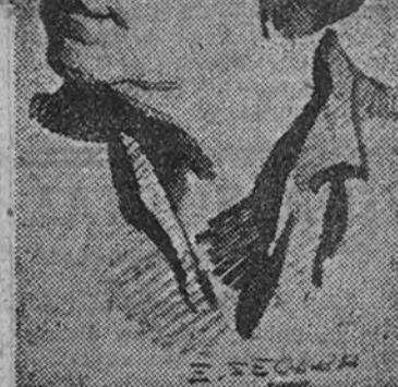
Anna Pauker manos varonilmente definieron como "Fera Neom Sidonius" (Sin Patria ni Dios). Esta especie de Fronte Popular, pretendiendo agrupar en su seno a cinco partidos políticos, no representaba en realidad más que el quince por ciento.

Hay indicios de que la continuación de la subida de precios reducirá aún más la ayuda en el momento en que entre en vigor el plan Marshall. (Continúa en cuarta pág.)