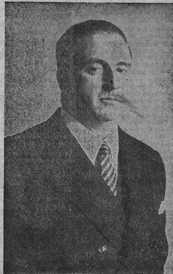
(DECLARACIONES EXCLUSIVAS DEL MINISTRO DE ASUNTOS EXTERIORES A LA AGENCIA LOGOS)

—Liquidada del todo en las Naciones Unidas la mal llamada "cuestión española", ¿cree usted que volverán a su plena normalidad nuestras relaciones diplomáticas?