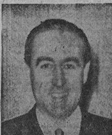
de la República Argentina en julio de 1947.

BUENOS AIRES 7. (Servicio especial de crónicas de la United Press. Prohibida la reproducción.) Las relaciones diplomáticas entre España y la Argentina alcanzaron en 1947 una intensidad sin precedentes, al iniciarse la que parece va a ser la etapa más importante en el intercambio comercial de ambas naciones. Asimismo se registraron manifestaciones de fraternidad de singular trascendencia histórica, que fueron símbolo del extraordinario acercamiento espiritual hispanoargentino observado recientemente. Estas han sido las opiniones que el embajador de España en la Argentina, don José María de Arellano, conde de Motrico, expuso al correspondiente de la United Press Henry Raymond, en el curso de una entrevista. El embajador español dijo también al cronista que al año de haber sido suscrita o tratado económico-financiero entre España y la Argentina, este país exportó a la nación hispana productos y mercancías por valor de casi cuatrocientos millones de pesos; es decir, aproximadamente la décima parte del total de las exportaciones argentinas durante el ejercicio de 1947. Añadió el señor Arellano que las importaciones argentinas procedentes de España fueron, sin embargo, considerablemente inferiores a la cifra anteriormente expuesta, debido principalmente a las restricciones decretadas por el Banco Central