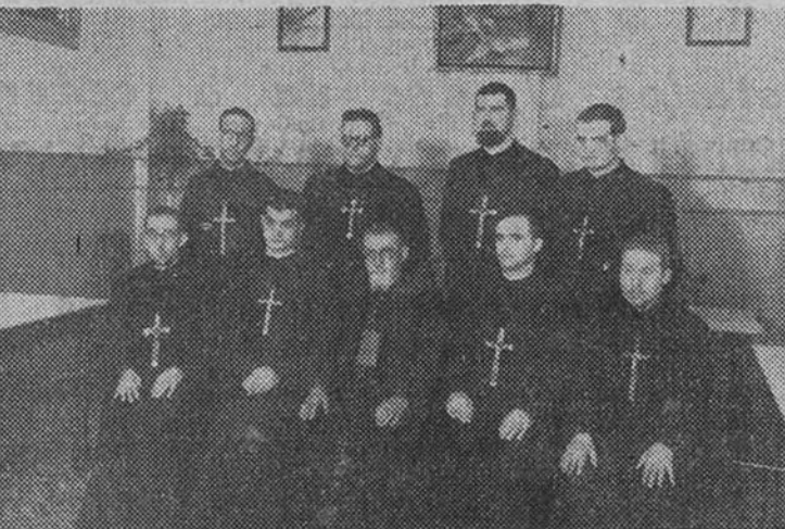
El obispo de Tonkin acompañado de los nuevos misioneros españoles que en breve saldrán para China, tras el acto de despedida e imposición de crucifijos.

El obispo auxiliar les entregó los crucifijos