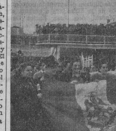
Miembros de la colonia mejicana en Madrid acudieron a recibir al "Veracruz" portando una bandera de Méjico, que exhiben jubilosamente.