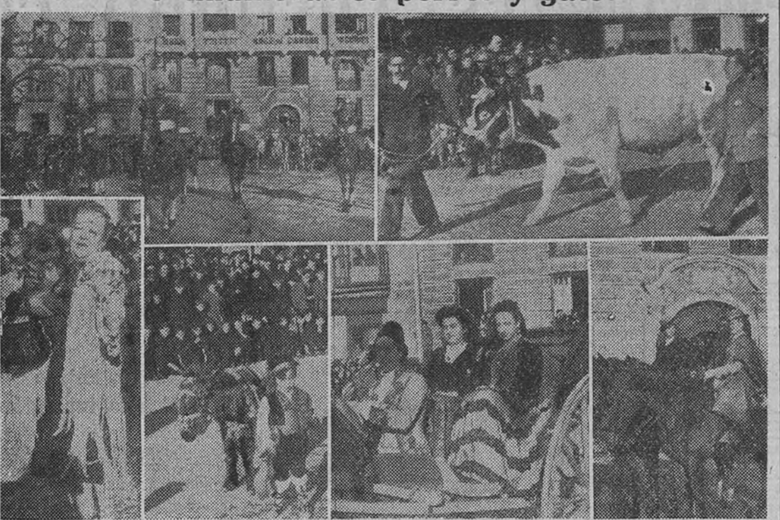
La fiesta de San Antón Abad ha congregado una vez más la alegría popular madrileña. Del gran tono conseguido para la tradicional romería por la Ténica de Alcaldía, del distrito del Hospicio dan idea es- tas notas gráficas, en las que se aprecian diversos aspectos del desfile, la formación de la Caballería, un magnífico ejemplar vacuno, el imprescindible lujó portado por una señora castizamente ataviada, un bucha más pequeño que su pequeño dueño, la típica calesa goyesca y las caballerías al estilo campesino andaluz.

Con gran animación, a la que contribuyó en alto grado el calor del sol, que lució radiante ayer, se celebraron los tradicionales fes- tejos de San Antón. La capilla de San Antón Abad, sita en el co- legio de los padres escolapios de la calle de Hortaleza, se vio muy con- currida durante toda la mañana y parte de la tarde. Gran número de fieles y devotos del Santo acudie- ron con animales de diversas cla- ses para recibir la bendición del sacerdote. Asimismo se reparte- ría gran cantidad de los tradiciona- les panecillos de San Antón, con lo que los alrededores de la capilla se vieron a toda hora llenos de co- rreos. El desfile y concurso que todos los años organiza la Tenencia de Alcaldía del distrito del Hospicio se inició a las tres de la tarde. Las calles de Hortaleza, Florida (hoy Megías Lequerica) y Barceño ha- bían sido engalanadas con galla- retes y colgaduras. En la calle de Barceño, dando espaldas al solar del Hospicio, se había levantado la tribuna para las autoridades y Ju- tos, que cuentan con existencias. Dos kilos de patatas, al precio de 1,30 pesetas kilo, a los distri- tos de PALACIO e INCLUSA, previo corte de los cupones co- rrespondientes de las semanas tercera y cuarta. Cien gramos de carne conge- lada, al precio de 15,45 pesetas ki- lo, incluido toda clase de im- puestos para la carne limpia, sin hueso ni sebo, previo corte del cupón número 11 de varios.