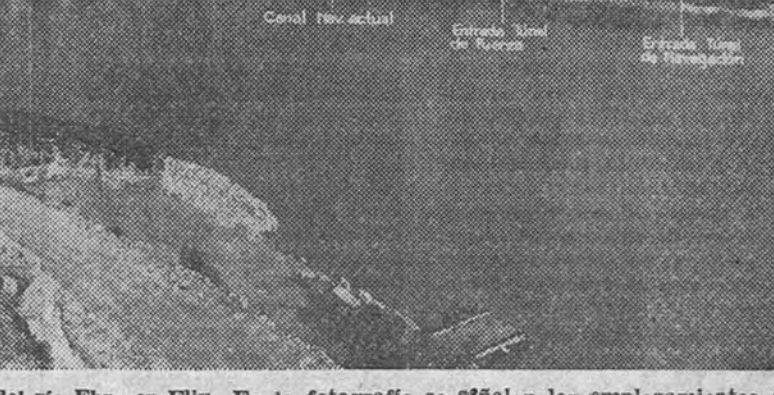
Vista panorámica de la presa del río Ebro en Flix. En la fotografía se señalan los emplazamientos de los túneles de fuerza y navegación

Los cuatro grupos, con un millón de kilovatios diarios, estarán ya en servicio en la semana próxima