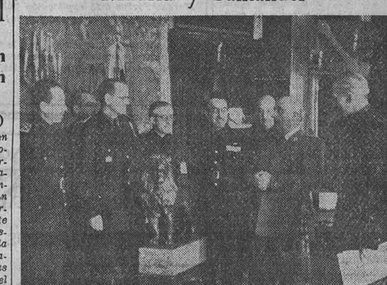
El Jefe del Estado, ante el Delegado Nacional del Frente de Juventudes, hace entrega a los Jefes Provinciales del Movimiento de Madrid y Santander de los trofeos de competiciones juveniles, correspondientes al año 1947, ganados por ambas provincias

Cumplimentaron a S. E. el Delegado Nacional y los Jefes Provinciales de Madrid y Santander