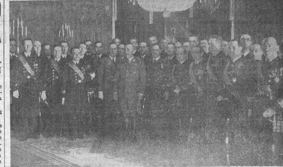
El Jefe del Estado, acompañado de los jefes de los distintos Cuerpos de la Armada, que han celebrado sus bodas de plata con la Marina y que con este motivo han testimoniado su homenaje al Generalísimo

"Los marinos caídos en la Cruzada--dijo Franco--murieron por la causa alta y noble de la grandeza de España"