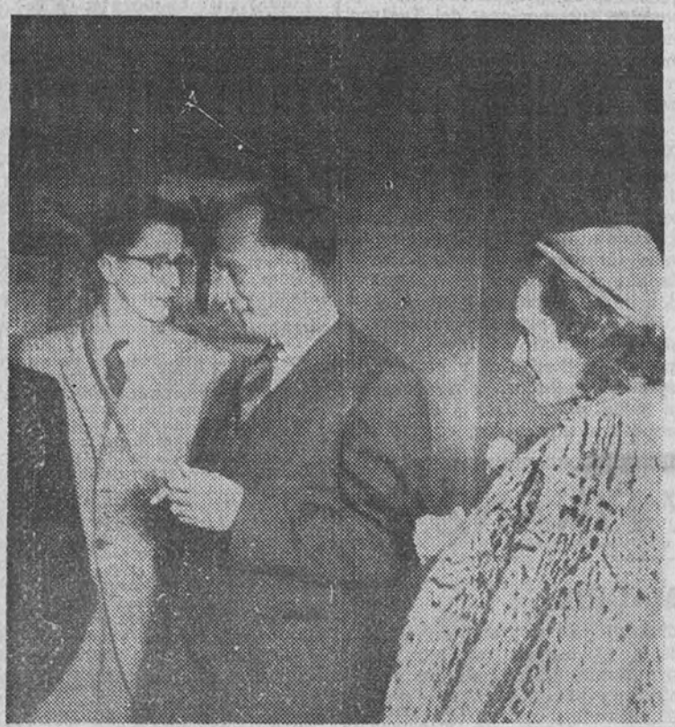
El Rey Leopoldo de Bélgica, con su esposa e hijos, en el aeropuerto de Barajas.

En la capital portuguesa embarcará con rumbo a La Habana (CRONICA DE LUIS DE LA BARGA DESDE LISBOA)