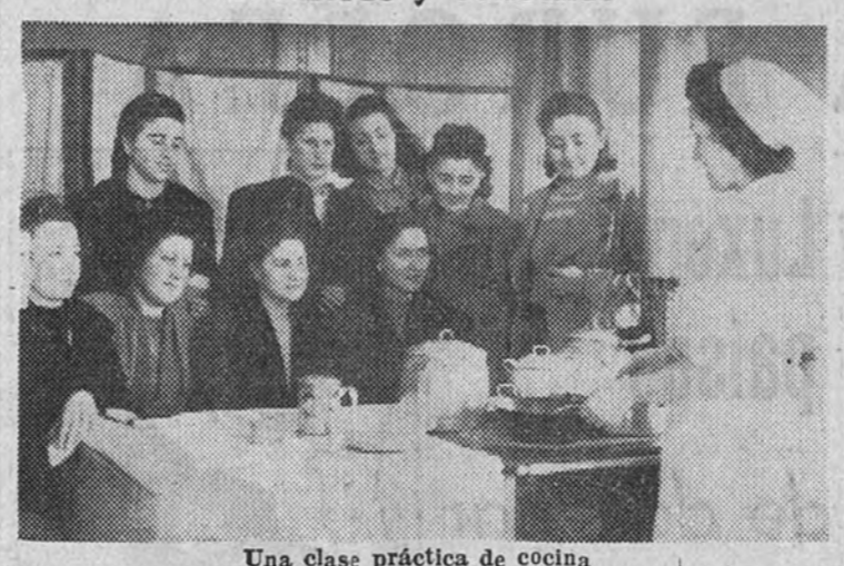
Una clase práctica de cocina

El 1 de febrero se iniciará una nueva modalidad de este centro: las clases especiales para cocineras y doncellas