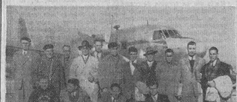
La selección española de boxeo aficionado, en el aeropuerto de Barajas, momentos antes de emprender el viaje a Londres

"Nuestros representantes pueden lograr en Dublín un empate", opina Tabanera