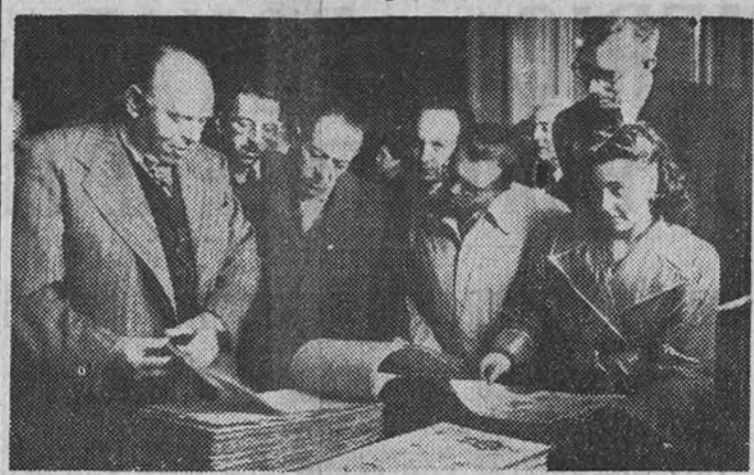
Don Romualdo de Toledo, director general de Primaria, durante la inauguración de la Exposición de álbumes escolares de las provincias españolas que serán entregados al Jefe del Estado.

El Ministro de Educación presidió la apertura de la Exposición