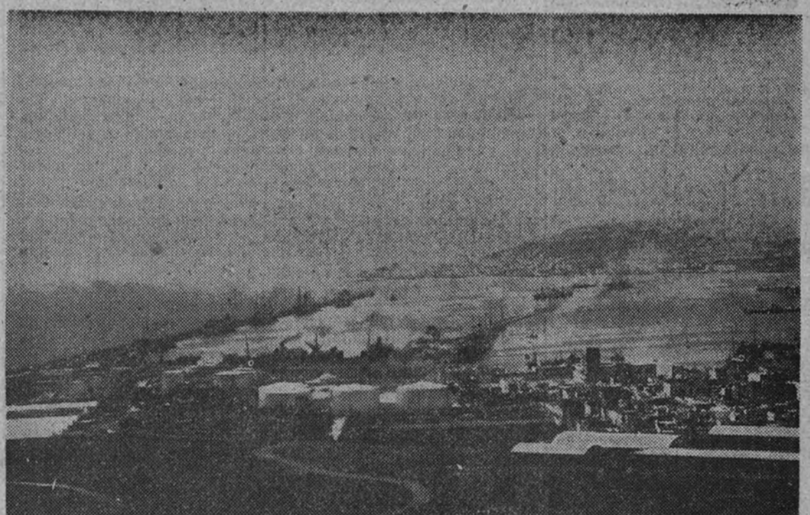
Una vista del puerto de La Luz, con sus muelles e instalaciones petrolíferas

3.660.619 toneladas más que en 1946 registró este puerto en el año último