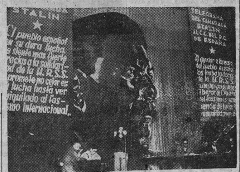
Un mitin comunista en el Madrid rojo

El documento en cuestión, una vez más, es una obra dirigida por el Komintern, y en ella se revela el verdadero motivo de la intervención soviética en la guerra de Liberación y España. Cuando uno lee este documento, se siente como si estuviera ante un espejo que refleja la verdadera naturaleza del Komintern. La guerra de España, por lo tanto, no fue una guerra civil, sino una guerra internacional, en la que el Komintern jugó un papel decisivo.