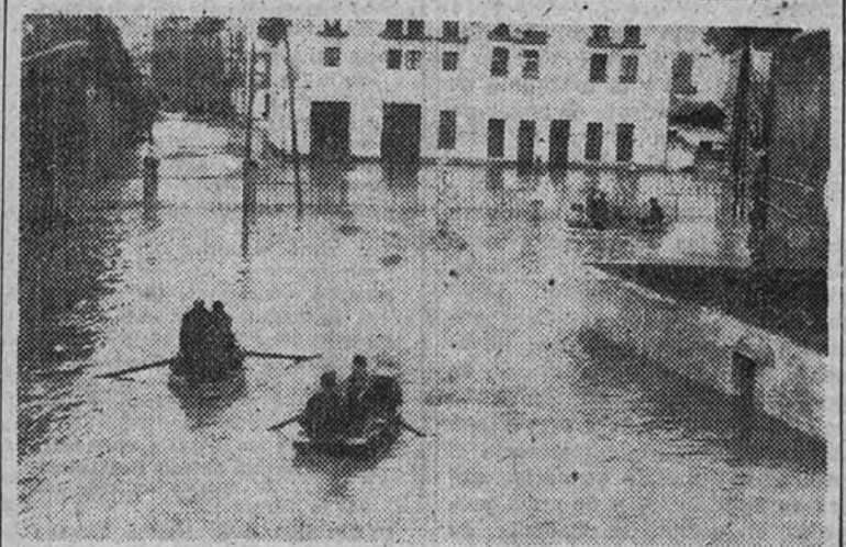
Las inundaciones en la calle de Oriente alcanzaron tal magnitud que los habitantes más perjudicados hubieron de ser puestos a salvo en lanchas.

SEVILLA 29. (De nuestro corresponsal, Salvador López de la Torre).—Sevilla amaneció bajo una cielo encapotado, movido por la larga fuerza del viento, que arrastraba, unas nubes finas como alfileres, Rizada el aprendizaje de la ción en pequeñas ondas la enfangada superficie de la inundación callejera, y el modesto y sucio oleaje golpeaba menudamente, con un nervioso aleteo, sobre los muros gastados de las casas o contra malecones improvisados con cuatro tablas y restos de cajas y silleros rotos. Pero el ritmo de los chaparrones ofrecía mayor pretexto a la esperanza, y entre el nublado de la catástrofe asomaba fugazmente la grieta azul de un pedazo de cielo. Hacia mediodía volaron las nubes y el sol pudo asomarse sobre el escenario del desastre. Aunque tarde, el sol no olvidaba del todo a Sevilla.