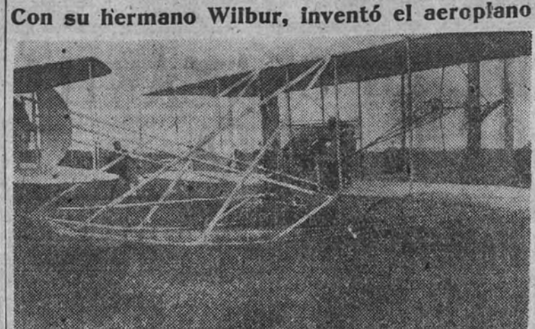
Los hermanos Wright se disponen a emprender uno de sus vuelos

Con su hermano Wilbur, inventó el aeroplano