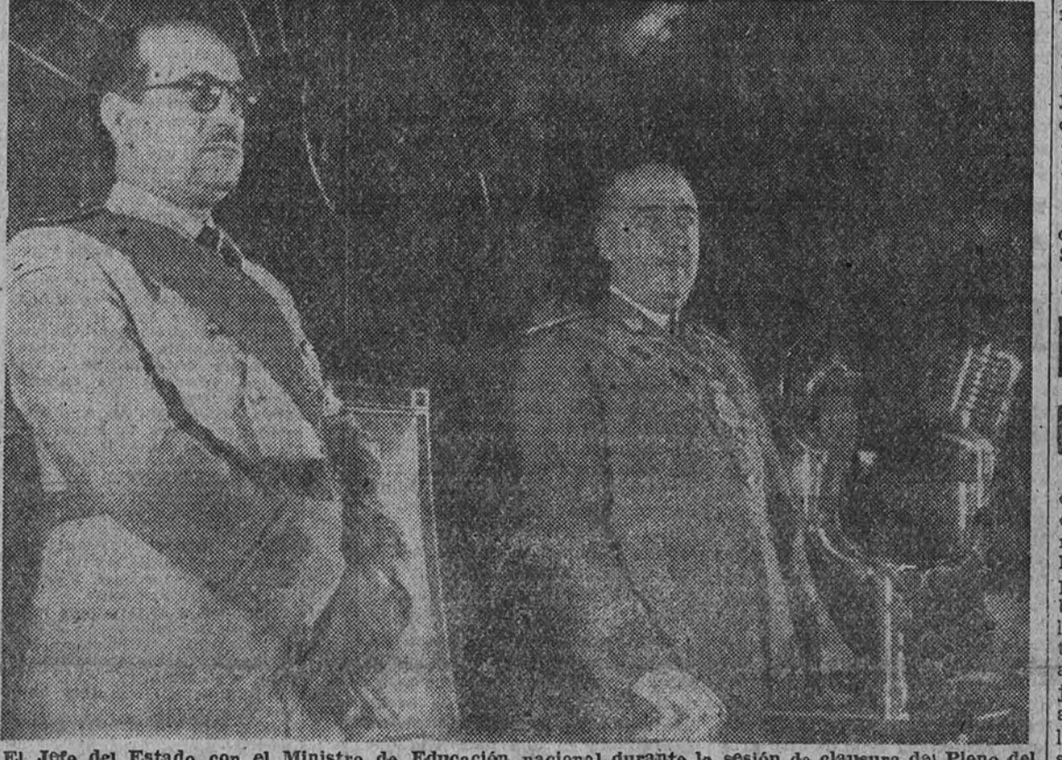
El jefe del Estado con el ministro de Educación nacional durante la sesión de clausura del Pleno del Consejo Superior de Investigaciones Científicas

S. E. entregó los Premios "Francisco Franco" de Letras y Ciencias y demás galardones e inauguró edificios del Consejo Concurrieron al acto numerosas personalidades, que aclamaron con entusiasmo al Caudillo de España