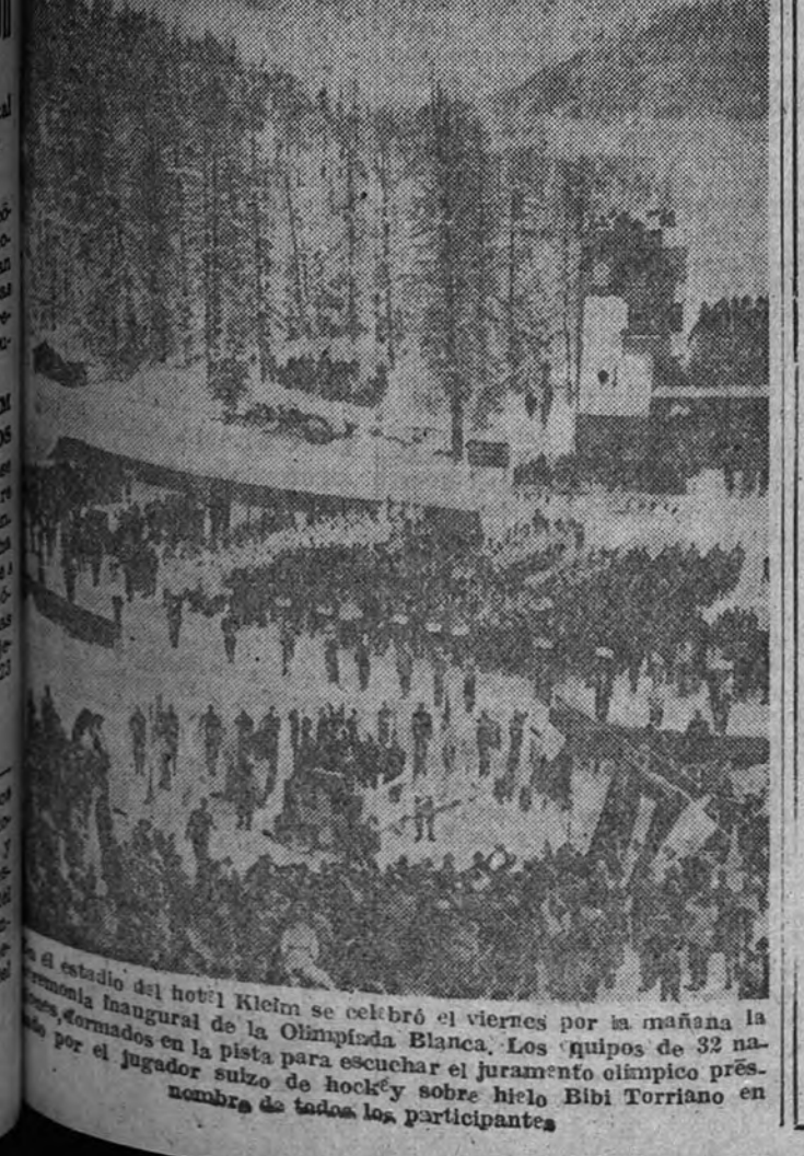
El estadio del hotel Klein se celebró el viernes por la mañana la ceremonia inaugural de la Olimpiada Blanca. Los grupos de 32 na- ciones, formados en la pista para escuchar el juramento olímpico pre- stado por el jugador suizo de hockey sobre hielo Bibi Torriani en nombre de todos los participantes.