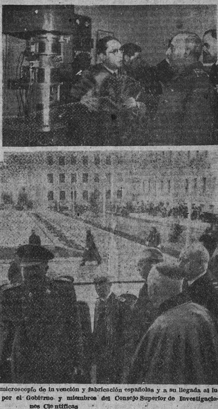
El Jefe del Estado examinando un microscopio de invención y fabricación españolas y a su llegada al lugar del acto, donde fué recibido por el Gobierno y miembros del Consejo Superior de Investigaciones Científicas