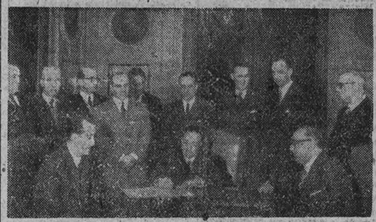
El director general de Seguridad firmando el contrato para la impresión del carnet de identidad

Tuvo lugar ayer con asistencia del director general de Seguridad y otras personalidades