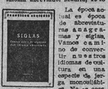
La época actual es época de abreviaturas, anagramas y siglas. Vamos a convertir nuestros idiomas de cultura en una especie de jerga monosilábica. No es cosa de lamentar este hecho, sino de reconocer la importancia que sobre todo en la vida comercial tienen los anagramas y las siglas. Recordemos, sin embargo, —al pensar en nuestras críticas de este hecho—, que en Inglaterra los anagramas están tan extendidos que hay necesidad de verdaderos diccionarios de ellos (una tarjeta de visita, por ejemplo, ofrece el nombre del poseedor seguido de quince o veinte iniciales). Por ello hay que alabar este ensayo de Francisco Arniches que, con un criterio de divulgación, ayuda al lector medio e incluso al profesional a interpretar este lenguaje un poco cabalístico de los anagramas. Además no es una seca enumeración, sino que la materia está expuesta, con gracia y amenidad.

FRANCISCO ARNICHES. Siglas. Ensayo sobre divulgación del idioma abreviado. Madrid, 1948