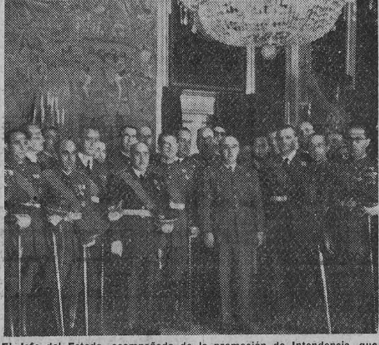
El Jefe del Estado, acompañado de la promoción de Intendencia, que recibió en el Palacio de El Pardo.