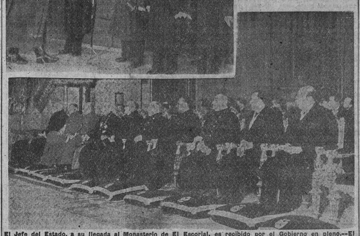
El jefe del Estado, a su llegada al Monasterio de El Escorial, es recibido por el Gobierno en pleno.—El Consejo del Reino, en el funeral por los Reyes de España. Esta es la primera ceremonia que asiste con carácter oficial.

Asistieron el Gobierno, el Consejo del Reino y el Cuerpo diplomático