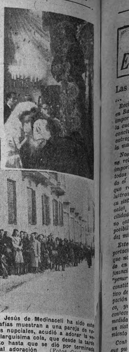
La afluencia de fieles al templo de Jesús de Medinaceli ha sido esta año extraordinaria. Nuestras fotografías muestran a una piedad de venerada imagen, y un aspecto de la tarasísima cola, que desde la tarde del jueves no decreció un momento hasta que se dio por terminada la tradicional adoración.

Parque de Intendencia de Madrid ANUNCIO Se admiten ofertas en pliego cerrado y lacrado hasta las doce de la noche del día 29 del actual, para la compra, venta y transformación de artículos que figuran en el rubro de anuncios y con grupo de clasificación a los pliegos de condiciones técnicas y económicas, que podrán examinarse en la Jefatura del Detall por aquellos que desearan su condición legal de vendedores. A las ofertas unirá escudillas que justifiquen que los precios por el que se paga y leña se refieren, haciendo constar tiempo que los artículos.